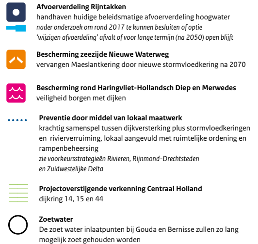
Kaart Deltabeslissing Rijn-Maasdelta inclusief Zoetwater

Extra berging van rivierwater op de Grevelingen in het geval alle keringen dicht zijn, blijkt geen kosteneffectieve oplossing. De veiligheid van Haringvliet, Hollandsch Diep en Merwed kan goed gewaarborgd worden door de dijken daar op orde te houden. De Deltabeslissing Rijn-Maasdelta doet geen uitspraak over een ander beheer van de Haringvlietssluisen. De sluisen worden in 2018 op "een kier" gezet. Besloten is daar eerst ervaring mee op te doen.