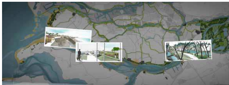
De inzending Rijn-Maasdelta op de Biënnale Rotterdam.

Heeft u geen uitnodiging ontvangen, maar wel belangstelling om aan de bijeenkomst deel te nemen? Dan kunt u zich aanmelden bij Deltaprogramma Rijnmond-Drechtsteden . Er zijn nog enkele plekken beschikbaar.