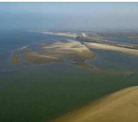
Droogvallende zandplaten langs de Zeeuwse kust bij de Veerse dam en Oosterscheldekering, gevormd door wind, golven en stroming.

deelprogramma Kust is in de ateliers nagedacht over de veiligheid van de kustregio's, zoals Zeeuws-Vlaanderen, Westkapelle en Vlissingen. Ambtelijk hebben de twee deelprogramma's afspraken gemaakt.