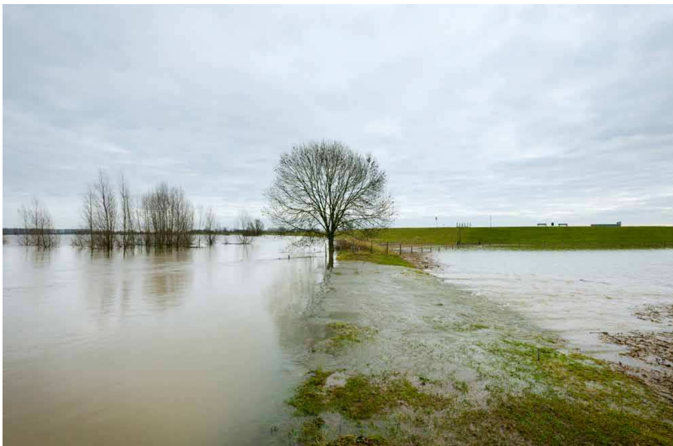
De waterveiligheidsnormen liggen onder de loep.

Naar aanleiding van het Algemeen Overleg is er een aantal moties van de Tweede Kamer aangenomen, onder andere een over de normering. De Staatssecretaris heeft de toegezegde brief inmiddels ook verstuurd.