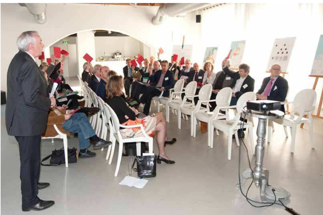
Meerlaagsveiligheid was een belangrijk thema tijdens de bestuurlijke conferentie Nieuwbouw en Herstructurering.

Een stad klimaatbestendig maken is bij uitstek een lokaal proces. Lokale partijen zijn hiervoor verantwoordelijk: zij ontplooi- en initiatieven, nemen besluiten en voeren deze uit. De rol voor deelprogramma Nieuwbouw en Herstructurering is het inspireren bij het zoeken naar mogelijkheden en het ontsluiten van kennis over praktijk en proces.