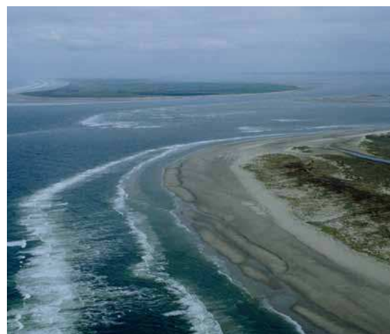
Suppletie voor de Noordzeewaddenkust wordt geoptimaliseerd, zodat het natuurlijke zandtransport wordt bevorderd en de geulen tussen de buitendelta's en Waddenzee hun functies behouden, zoals bij het Borndiep tussen Terschelling en Ameland.

Daarnaast onderzoekt het deelprogramma Zuidwestelijke Delta mogelijkheden om dammen multifunctioneel te gebruiken en is afgesproken dat het deelprogramma Kust samen met de Provincie Zeeland de strategieën voor de eilandkoppen voorbereidt. De analyses, mogelijkheden en doelen worden tussen de deelprogramma's uitgewisseld, om tot eenduidige besluitvorming te kunnen komen.