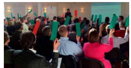
Stemmen vóór of tégen tijdens een discussie over onze zoetwatervoorziening.

In het afgelopen jaar hebben Rijksoverheid, waterschappen, provincies en gemeenten