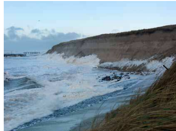
De deltabeslissingen bevatten de hoofdkeuzen voor onze waterveiligheid en zoetwatervoorziening.

In DP2013 worden deze vraagstukken nader toegelicht. Zeker is dat in het hele gebied maatregelen nodig zijn om de waterveilig-