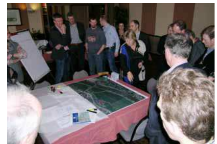
De opbrengst uit de werkateliers zijn input voor het nieuwe Masterplan Middengebied IJsselsprong.

Het kader voor de ruimtelijke ontwikkelingen is de InterGemeentelijke StructuurVisie (IGSV) IJsselsprong, die in 2008 is gemaakt door de gemeenten Brummen, Voorst, Zutphen, Waterschap Veluwe, provincie Gelderland en het ministerie Infrastructuur en Milieu. In de IGSV komen de ontwikkeling van infrastructuur, woningbouw, rivierveiligheid en natuur samen in één integraal plan. Bij de ruimtelijke plannen hebben zich nieuwe ontwikkelingen voorgedaan. De belangrijkste daarvan is de verminderde omvang en het lagere tempo van de woningbouwopgave in de IJsselsprong. Wel blijft de wens voor een rondweg overeind en is recent de verkenning gestart naar een mogelijke rondweg rond De Hoven. Voor de oostzijde van de IJssel bij Zutphen is met name het programma Rivier in de Stad van belang. Dit is voor het Zutphense college een prioriteit. De aanpak van de IJsselkade is hiervan een onderdeel.