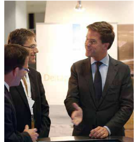
Minister-president Rutte bij de eerste versie van de Deltaviewer op het Nationale Deltacongres in november 2011.

Ieder deelprogramma van het Deltaprogramma heeft een inhoudelijke bijdrage geleverd en kan na de zomer aan de slag met de gebiedsgerichte toepassing van de Deltaviewer. Op dit moment vindt overleg