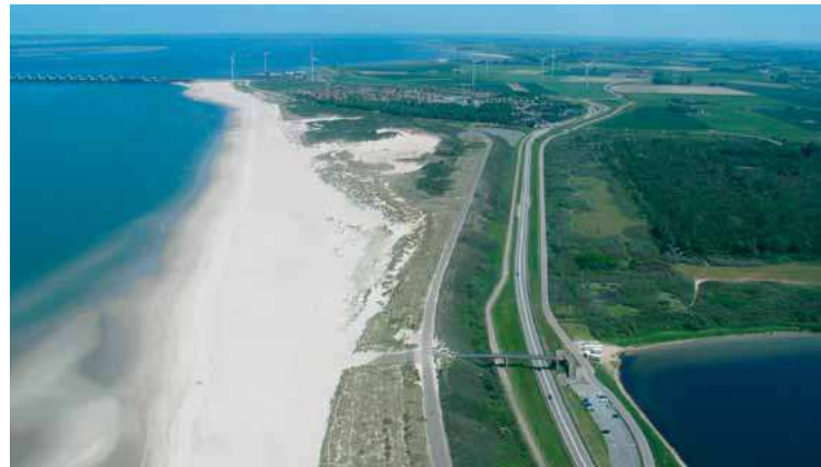
In de Zuidwestelijke Delta zijn meer kansen dan nu benut worden.

vard van Knokke verbindt met die van Scheveningen. Ook op andere gebieden moeten we meer het gesprek met Vlaanderen aangaan. Conclusie van de middag: een gezonde, veilige delta met een robuust watersysteem draagt bij aan de economische ontwikkeling.