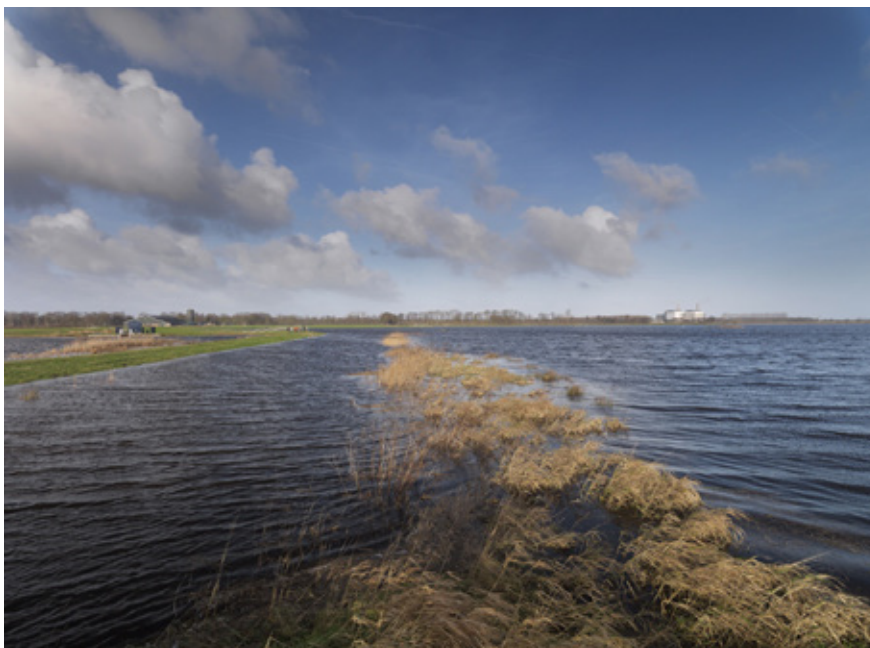
De intensieve samenwerking in het Deltaprogramma tussen regio's en Rijk, die veel waardering krijgt, wordt ook in de komende fase voortgezet. Waterberging in de Soestpolder bij Burgum.

Die deltabeslissingen en voorkeursstrategieën vormen de kern van het Deltaprogramma 2015, dat met Prinsjesdag aan de Staten-Generaal is aangeboden. De deltacommisaris doet daarin ook een voorstel voor de inrichting van de organisatie voor het vervolg. Kern hiervan is dat de intensieve samenwerking tussen Rijk en regio, die veel waardering geniet, wordt voortgezet (zie voor een uitgebreid overzicht van de plannen voor de nieuwe organisatie DeltaNieuws nr. 3 (2014) , p. 4. De komende jaren ligt het accent van het Deltaprogramma op het uitwerken van de genomen besluiten, de verdere ontwikkeling van de adaptieve aanpak en de uitvoering van maatregelen in de verschillende regio's. Tijdens het Nationaal Bestuurlijk Overleg (het overleg tussen