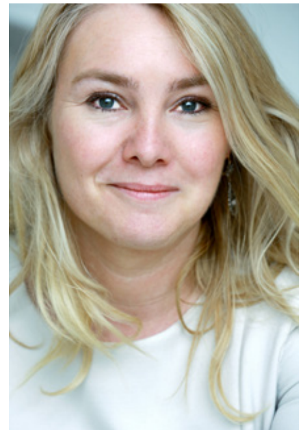
Minister Schultz van Haegen: “We vinden het in ons land veel te vanzelfsprekend om zo goed beschermd te zijn.”

“Voor mij zijn twee dingen nu belangrijk: ten eerste leg ik de beslissingen vast in bestaande wetgeving, zoals de Waterwet en het Nationaal Waterplan. Dat doen we ook met de nieuwe normen voor veiligheid. Hiermee kunnen we veel gericht investeren op die plekken waar het echt nodig is. En ten tweede is het belangrijk om de samenwerking uit het Deltaprogramma vast te houden. Regionale samenwerkingsverbanden, maar ook het verbinden van vraagstukken en maatregelen, blijven cruciaal.”