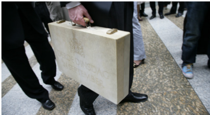
De deltacommissaris gaat ervan uit dat het kabinet tijdig besluit over de continuering van de voeding van het Deltafonds, zodat ook voor de jaren na 2028 genoeg geld beschikbaar is.

Naast de investeringen door het Rijk is medebekostiging door andere betrokken