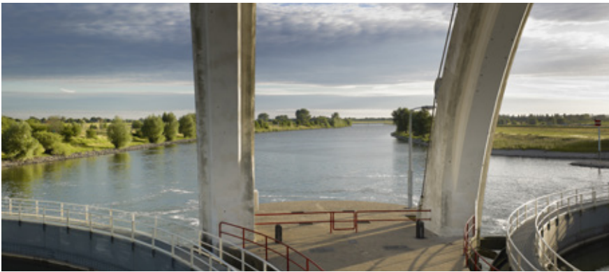
Stuw bij Driel.