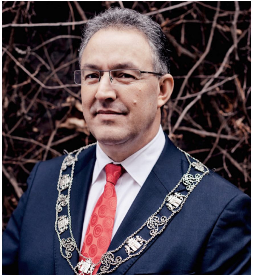
Burgemeester Ahmed Aboutaleb van Rotterdam en voorzitter van de stuurgroep Rijnmond-Drechtsteden: “De samenwerking van de afgelopen jaren, gericht op beleidsvorming, heeft de basis heeft gelegd voor een nieuwe vorm van samenwerking in de uitvoering.”

“Dat proces was uniek. Er is een vraag gesteld aan de regionale partijen om samen met het Rijk tot een langetermijnstrategie te komen en daarin vanaf het begin alle belanghebbenden te betrekken. Dat was experimenteren, zoeken naar de verbinding en gebruiken van de kennis en ervaring die elke partij heeft, maar heeft opgeleverd dat de voorgestelde strategie ook hún strategie is geworden. Vanaf de start heb ik erop gehamerd dat we ons gezamenlijk richten op de inhoud en niet op de belangen. Geen discussies over geld en verantwoordelijkheden voordat we samen onderzocht hebben wat nodig is, wat kan en wat kansen biedt voor de regio. Het beschermen van de inwoners en de economische waarde in deze regio staan centraal en als we daarmee ook (ruimtelijke en economische) waarde kunnen toevoegen, hebben we het goed gedaan.”