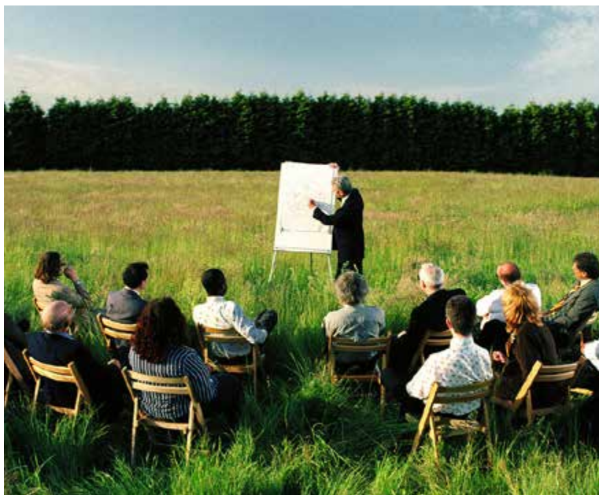
In de regiosessies komen nadrukkelijk ook de voorbereidingen in beeld die regio's treffen om het nieuwe waterveiligheidsbeleid te implementeren.

Het ministerie van Infrastructuur en Milieu organiseert de regiosessies samen met de Unie van Waterschappen. Ook vertegenwoordigers van provincies, programmamanagers van het Deltaprogramma, het Hoogwaterbeschermingsprogramma en de Stowa worden bij de organisatie betrokken. De sessies bieden managers een platform waar de verschillende partijen elkaar kunnen ontmoeten, informatie wordt uitgewisseld en gezamenlijk verkend wordt wat er nodig is, om het nieuwe waterveiligheidsbeleid te implementeren.