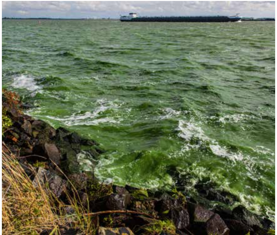
Het Volkerak-Zoommeer heeft last van blauwalg. Het verbeteren van de waterkwaliteit is een belangrijke impuls om de regionale economie en ecologie te versterken.

In de Grevelingen breiden zuurstofarme waterlagen bij de bodem zich steeds verder uit en het Volkerak-Zoommeer heeft last van blauwalgenplagen. In de Ontwerp-Rijksstructuurvisie Grevelingen en Volkerak-Zoommeer die in oktober 2014 is vastgesteld, heeft het Rijk aangegeven dat er geen zicht is op autonome verbetering van de waterkwaliteit van de Grevelingen en dat het onduidelijk is of de recente kwaliteitsverbetering in het Volkerak-Zoommeer doorzet. Het terugbrengen van een beperkt getij via