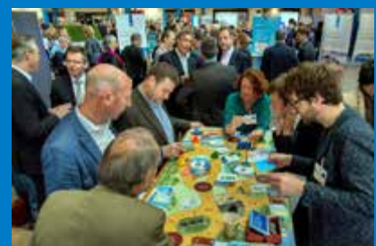
Het Deltacongres vorig jaar.

De hele dag biedt de Deltaparade volop tijd en gelegenheid om op informele wijze kennis en ervaringen uit te wisselen. Bijvoorbeeld bij de meetingpoints voor de zeven gebieden en bij de stands van programma's en projecten die verbonden zijn met het Deltaprogramma. Tijdens de lunch is er bij de meetingpoints ook gelegenheid voor diverse meet & greets met bestuurders.