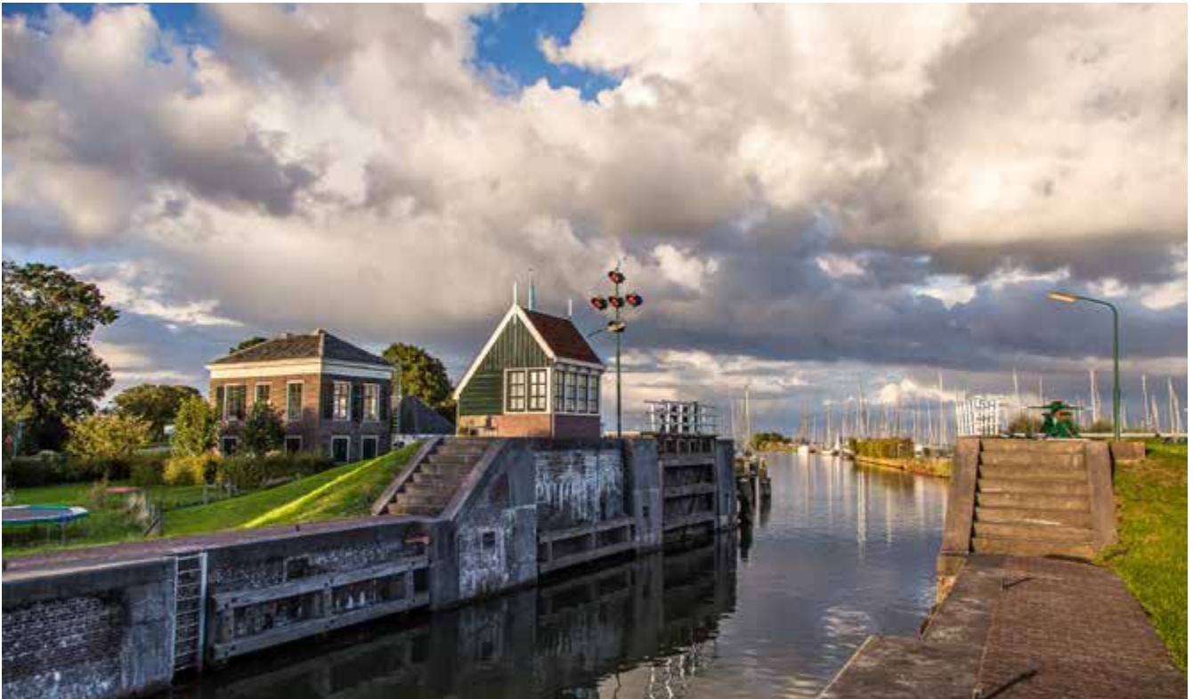
De foto van de zeesluis in Edam illustreert de complexiteit van de dijkversterkingen: versterken in een gebied met vele functies en belangen, zoals een monumentale zeesluis, een jachthaven, buitendijkse camping en bewoning.

Ruim 33 kilometer Markermeerdijken tussen Hoorn en Amsterdam zijn in 2006 bij de toetsronde van het Tweede Hoogwaterbeschermingsprogramma afgekeurd. De dijken zijn niet stabiel genoeg om 1,2 miljoen Noord-Hollanders tegen het water te beschermen. Hoogheemraadschap Hollands Noorderkwartier maakt plannen, om de dijken tussen 2016 en 2021 te versterken. Geen eenvoudige opgave aangezien de dijk een geliefd cultuurhistorisch monument is met karakteristieke dorpen, hoge natuurwaarden aan beide zijden en aantrekkelijke recreatieve mogelijkheden.