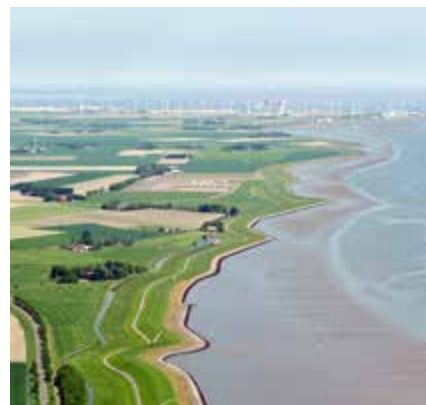
De Eems en de Eemshaven. De zeedijken tussen Eemshaven en Delfzijl voldoen niet aan de nieuwe veiligheidsnormen. Waterschappen, gemeenten, provincies, Rijk en natuurorganisaties gaan gezamenlijk aan de slag om de dijken op korte termijn te versterken, maar met oog voor natuur, economie en recreatiemogelijkheden.

Vanuit het Deltaprogramma en de voorkeursstrategie van het Deltaprogramma Waddengebied heeft de provincie Groningen voor dit traject onderzoek gedaan naar twee nieuwe dijkconcepten. Het eerste concept - de 'rijke dijk' is een dijk waarop aan de waterkant de natuur beter gedijt. Met poeltjes vol krabbetjes, kreeftjes en garnalen is het straks leuk om bij de dijk te kijken naar deze nieuwe natuur, die de biodiversiteit van het gebied vergroot. Een tweede nieuw dijkconcept is de 'dubbele dijk'. Het waterschap en de provincie doen hier samen onderzoek naar waterveiligheidsaspecten van de tweede dijk. In een pilot wordt binnendijks een zone van