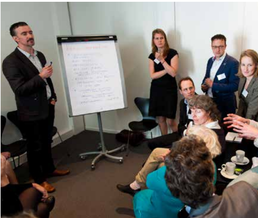
In workshops werden de kansen voor samenwerking besproken.

Wilt u meer informatie over het Nationaal Kennis- en Innovatieprogramma Water- en Klimaat? Zie www.NKWK.nl voor het verslag van de startconferentie.