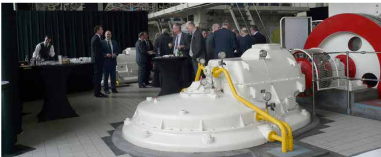
De ondertekening vond plaats in de toepasselijke omgeving van Gemaal Wortman, een van de drie gemalen die werd gebruikt voor het droogmaken van de polder Oostelijk Flevoland.