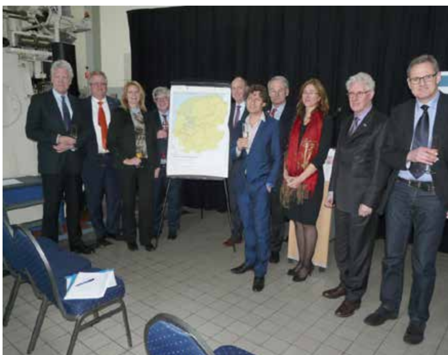
De ondertekenaars van het Pact IJsselmeergebied naast de kaart met handtekeningen.