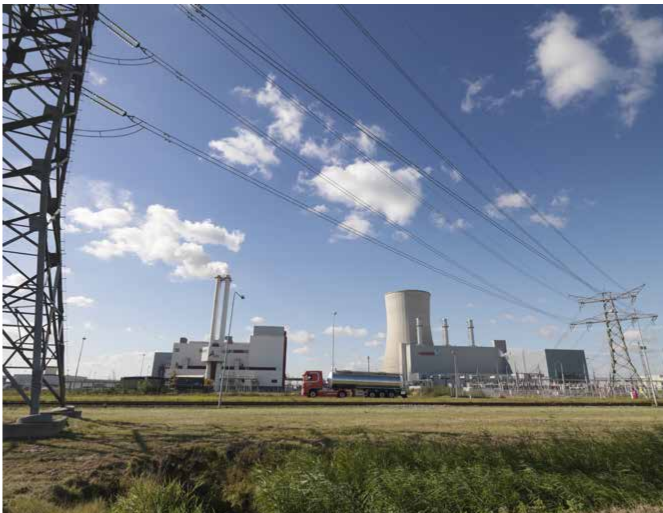
Eletriciteitscentrale in Moerdijk, een voorbeeld van vitale infrastructuur.

beleid en plannen. Dat gebeurt met maatwerk dat past bij de ruimtelijke ordeningsinstrumenten in de betreffende provincies, zoals provinciale waterplannen, omgevingsvisies, omgevingsplannen en structuurvisies. Voor de verankering door de waterschappen zijn de waterbeheerplannen belangrijk, die eind 2015 worden vastgesteld. De gemeenten spelen een centrale rol bij de implementatie van de Deltabeslissing Ruimtelijke Adaptatie. Zeker wat betreft wateroverlast staat dit al goed op de agenda bij gemeenten. De komende maanden zullen resultaten van de lopende enquête over ruimtelijke adaptatie (zie ook artikel p. 11 ) en de