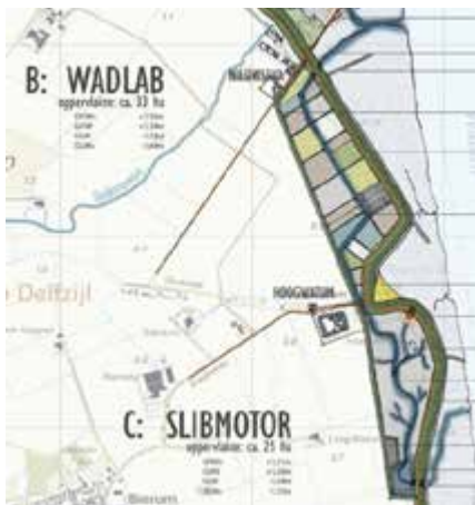
De 'dubbele dijk' laat het binnendijkse gebied zien tussen de twee dijken. Het bovenste deel (tot de versmalling) is voor aquacultuur en innovatieve landbouw en het onderste deel voor slibwinning.

Dat de nieuwe dijkconcepten met grote snelheid opgepakt worden en daadwerkelijk in de praktijk gebracht worden, heeft te maken met de urgentie die leeft om de dijk aardbevingsbestendig te maken, maar zeker ook met de bestuurlijke samenwerking rond het project Marconi die de aanpak ervan bespoedigt.