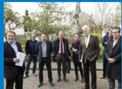
Deltacommissaris Wim Kuijken zag hoe de wijk Betondorp regenbestendig en waterrobuust wordt gemaakt.

maken. Dat gebeurt onder meer met groene daken, waterdoorlatende kratten in de grond en door het verminderen van verhard oppervlak. Tijdens een vaartocht door het havengebied Westpoort kreeg de deltagoedkoopster te zien hoe vitale en kwetsbare functies in het gebied beter beschermd kunnen worden voor het geval er toch een overstroming vanuit rivier de Lek of de Noordzee (via IJmuiden) plaatsvindt.