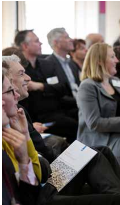
Deltacommissaris Wim Kuijken: "Samenwerking tussen alle overheidslagen en betrokken stakeholders is de kern van het Deltaprogramma en noodzakelijk om het doel te bereiken."

De aanpak van het Deltaprogramma wordt gekenmerkt door flexibiliteit en adaptatiemogelijkheden en probeert vanuit 'soft power' vele stakeholders in beweging te brengen naar 'een stip aan de horizon'. Deze aanpak is ook in veel andere domeinen veelbelovend en kansrijk. Desalniettemin is het geen gemakkelijke opgave, zo bleek tijdens het symposium. Urgentie, belangen,