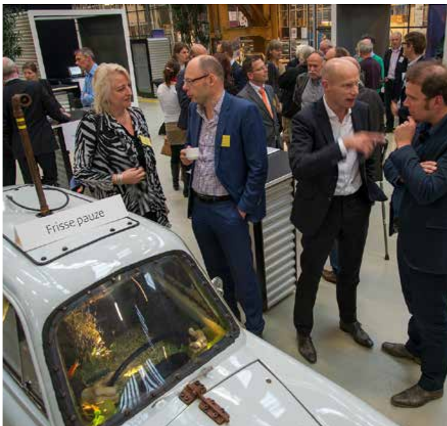
De manifestatie 'Ontwerp Delta.NL' vorig jaar: het ruimtelijk ontwerp is een belangrijk instrument om de ruimtelijke kwaliteit te borgen.

PostbusDeltaOntwerpplatform@minienm.nl .