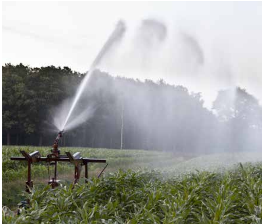
De uitvoering van de eerste zoetwatermaatregelen is gestart.

De bestuurlijke afspraken tussen partijen over de uitvoering worden vastgelegd in regionale bestuursovereenkomsten. Hiermee wordt de betrokkenheid van alle partijen geborgd. Ook worden zo sturingslijnen en verantwoordelijkheden vastgelegd, evenals