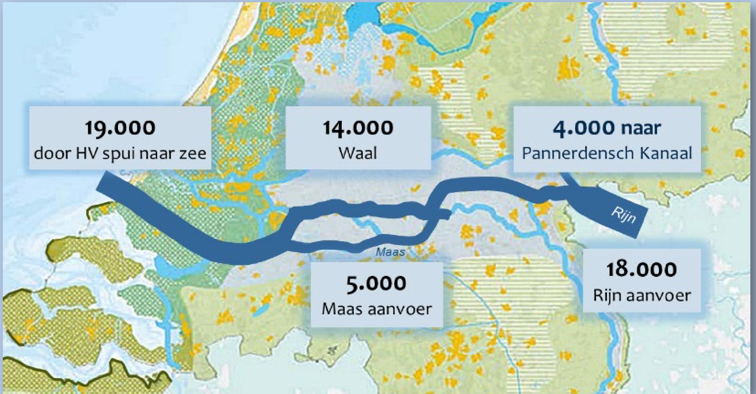
Plan Beaufort, werking bij extreme rivierafvoeren van Rijn en Maas