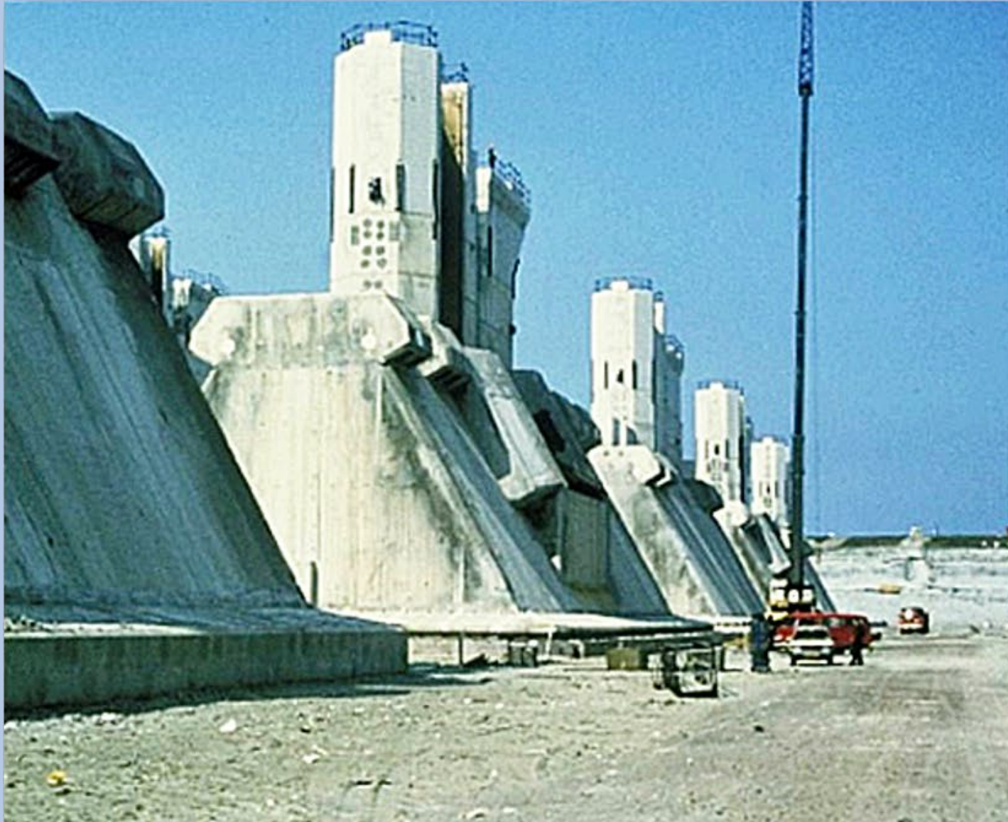
Oosterschelde kering, bouwputten