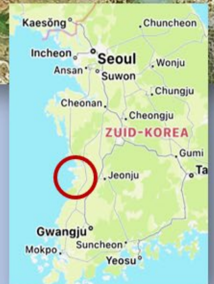
Saemangeum afsluitdam 35 km Zuid Korea 1991 - 2006