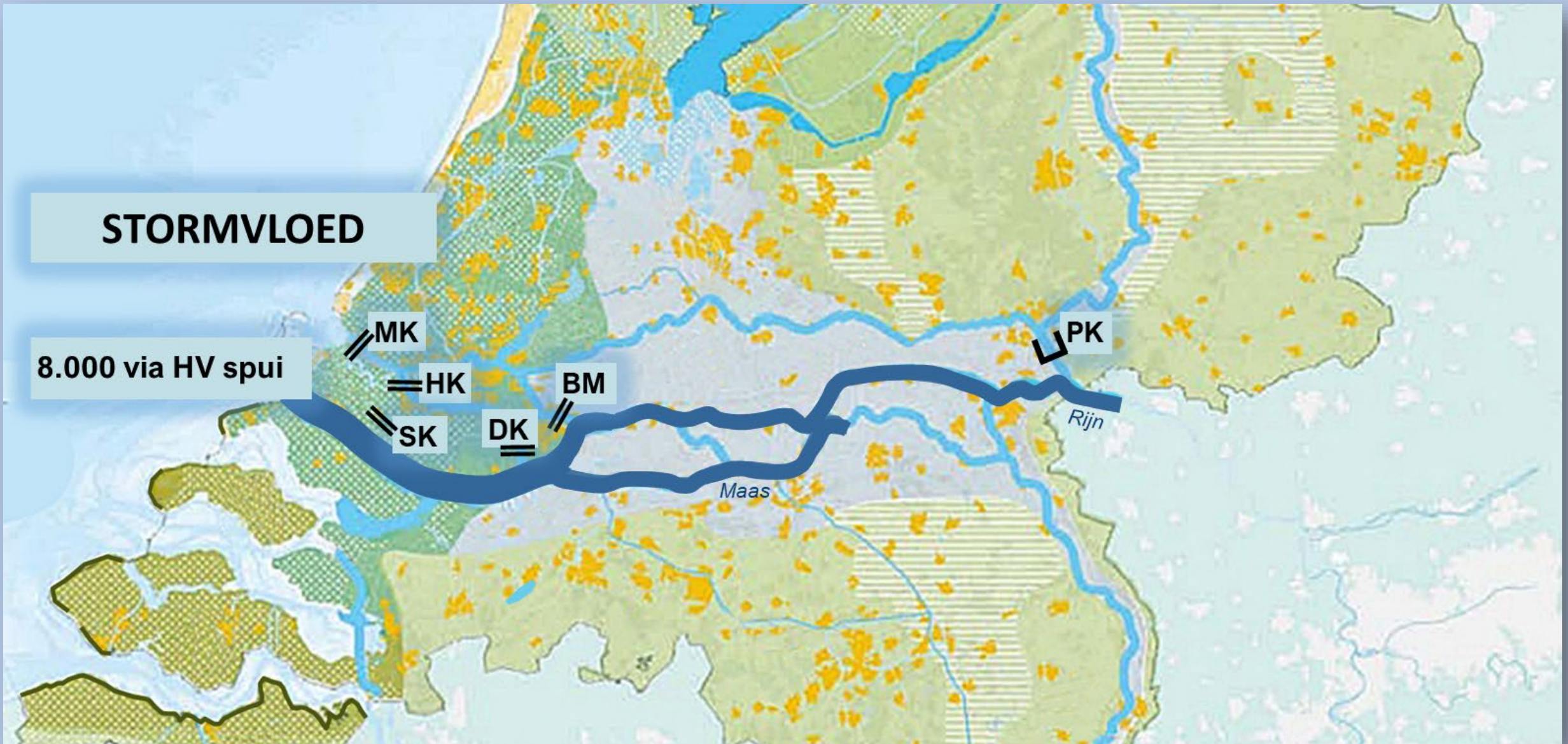
Plan Beaufort, werking bij stormvloed én matig hoge rivierafvoeren