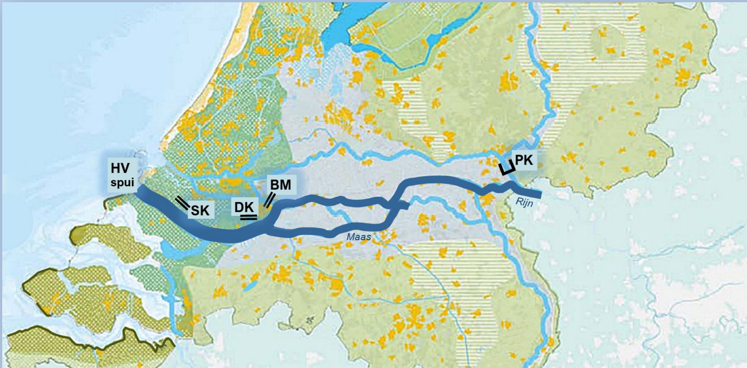
Plan Beaufort, rivierwater corridor met rivier-deltadijken en vier extra waterwerken, rivierwater-regulatiewerk in het Pannerdensch Kanaal (PK) en drie keersluizen in Beneden Merwede, Dordtse Kil en Spui (BM, DK, SK)