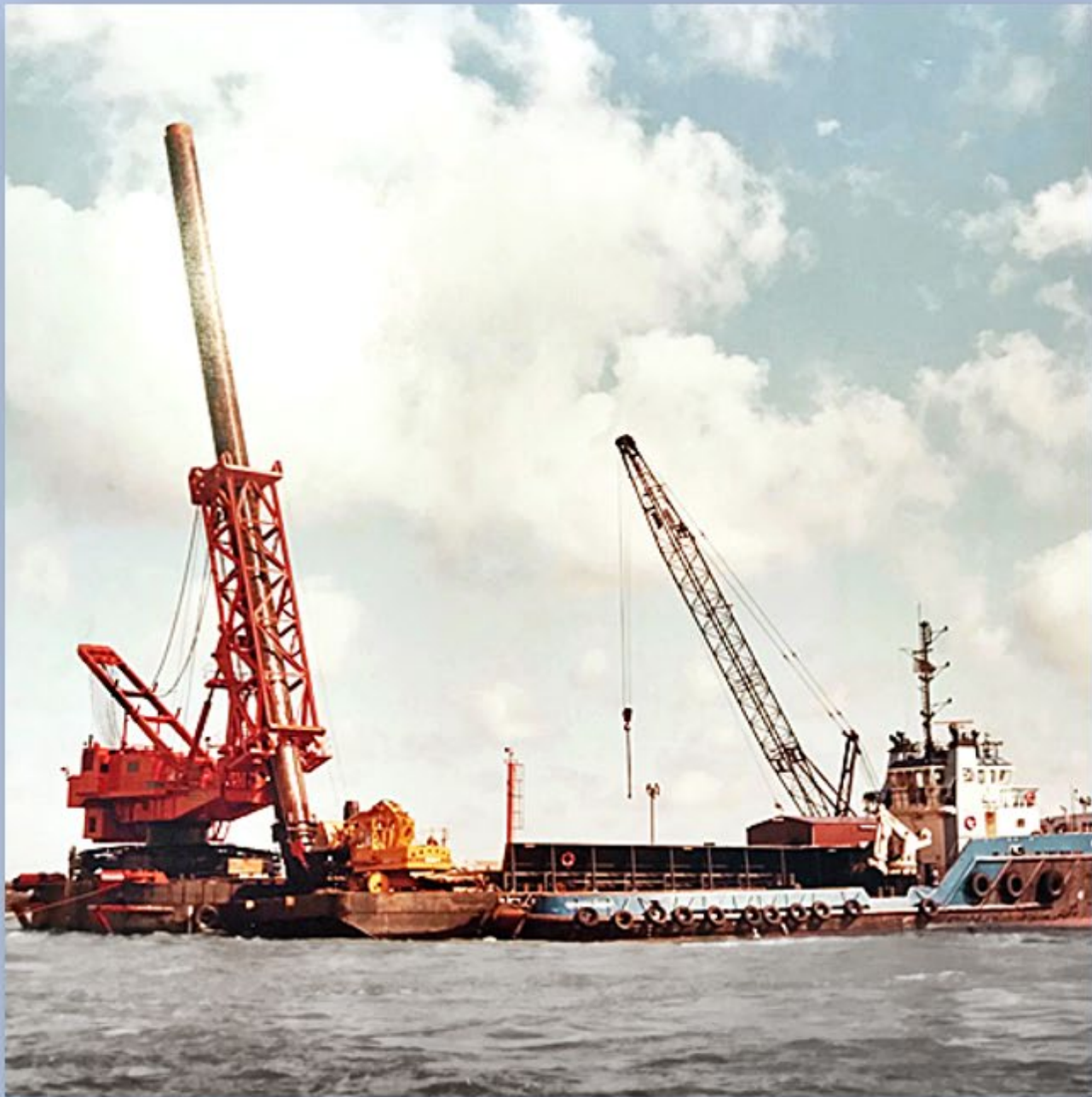
Oosterschelde kering, plaatsen van stortstenen drempels