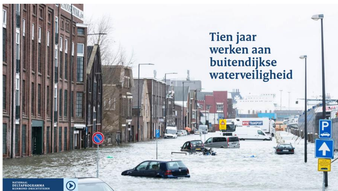
Publicatie Tien jaar werken aan buitendijkse waterveiligheid

In 2017 is de eerste Strategische Adaptatie Agenda opgesteld in samenwerking met Royal HaskoningDHV. Deze agenda bevat 22 acties en is opgesteld op basis van de Voorkeursstrategie 2014-2020. Er is in de kwartaalbijeenkomsten van het DPRD Platform Buitendijks in 2021 en 2022 de behoefte uitgesproken de Strategische Adaptatie Agenda te updaten, omdat 1) het niet meer helemaal aansluit bij de actualiteit en 2) prettig is een beknopter document te hebben.