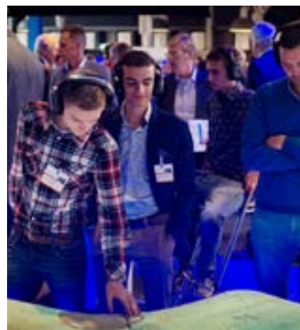
Op de foto bekijken bestuursleden van het Jeugdwaterschap de presentatie 'Zand' op de Deltaparade.

Jongeren waren opvallend goed vertegenwoordigd op dit Deltacongres. Zo waren er alleen al zeventig leerlingen van de Hogeschool Zeeland die een studie volgen op de Delta Academy op het gebied van water, land en leven in deltagebieden.