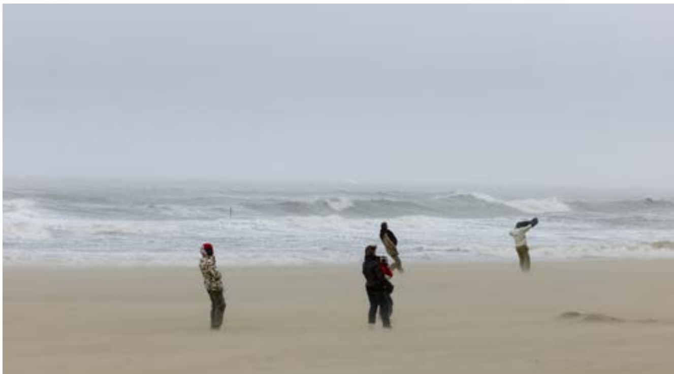
Storm op het strand van Scheveningen.