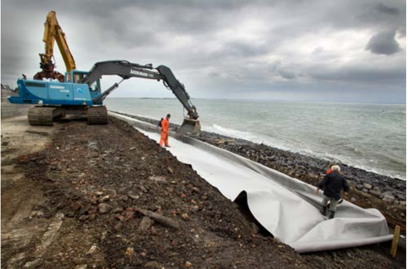
Het Deltaprogramma komt in de volgende fase van uitwerken en implementeren. Hier werkzaamheden aan de dijk bij Strijenham op Tholen.

het Hoogwaterbeschermingsprogramma (HWBP) en de gebiedsoverleggen, om tijdig meekoppelkansen en mogelijke uitwisseling met brede, gecombineerde oplossingen te kunnen opmerken. In het eerste kwartaal van ieder jaar kan in de stuurgroep de conceptprogrammering HWBP in de gebiedsoverleggen besproken worden. De betrokken waterbeheerders zullen hier zorg voor dragen. Waar sprake is van brede gecombineerde oplossingen wordt de sturing en de regie gevoerd vanuit de gebiedsoverleggen. Ook is gesproken over de verbinding met het proces van het Meerjarenprogramma Infrastructuur, Ruimte en Transport (MIRT). Onderwerpen komen in het MIRT-overleg op de agenda als er een bredere afweging aan de orde is en synergie mogelijk is. Dubbelingen op agenda's moet worden voorkomen. Waterschappen kunnen bij de MIRT-overleggen aanwezig zijn. Dat dat goed werkt, blijkt uit de ervaring van Bestuurlijk Overleg MIRT-Oost.