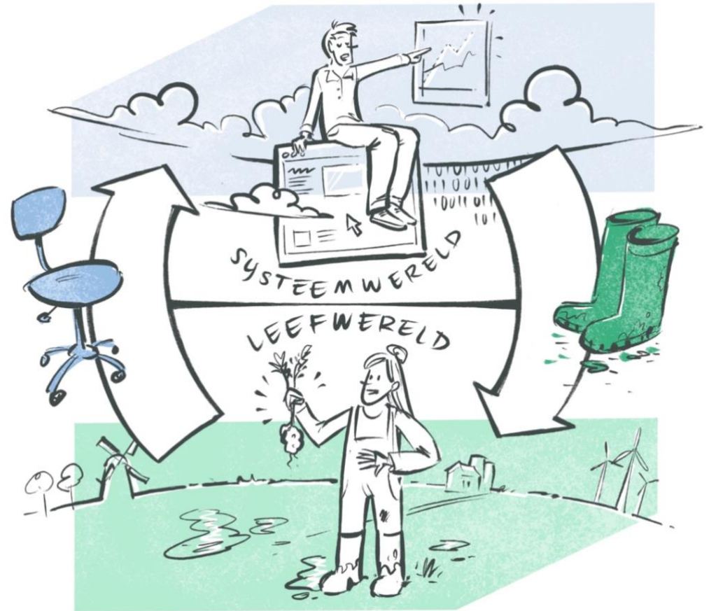
Twee manieren om de verbinding tussen leefwereld en systeemwereld te leggen, doormiddel van Participatieve Waarde Evaluatie (PWE) en Social Design.

Social Design kiest bewust de omgekeerde benadering. De logica, taal en referentiekaders van de leefwereld vormen het uitgangspunt. Lokale afwegingen en betekenissen worden gezien als waardevolle input voor communicatie, participatie en besluitvorming. Zo kan deze aanpak bestaande methoden aanvullen en bijdragen aan een breder en mensgericht perspectief binnen het Deltaprogramma.